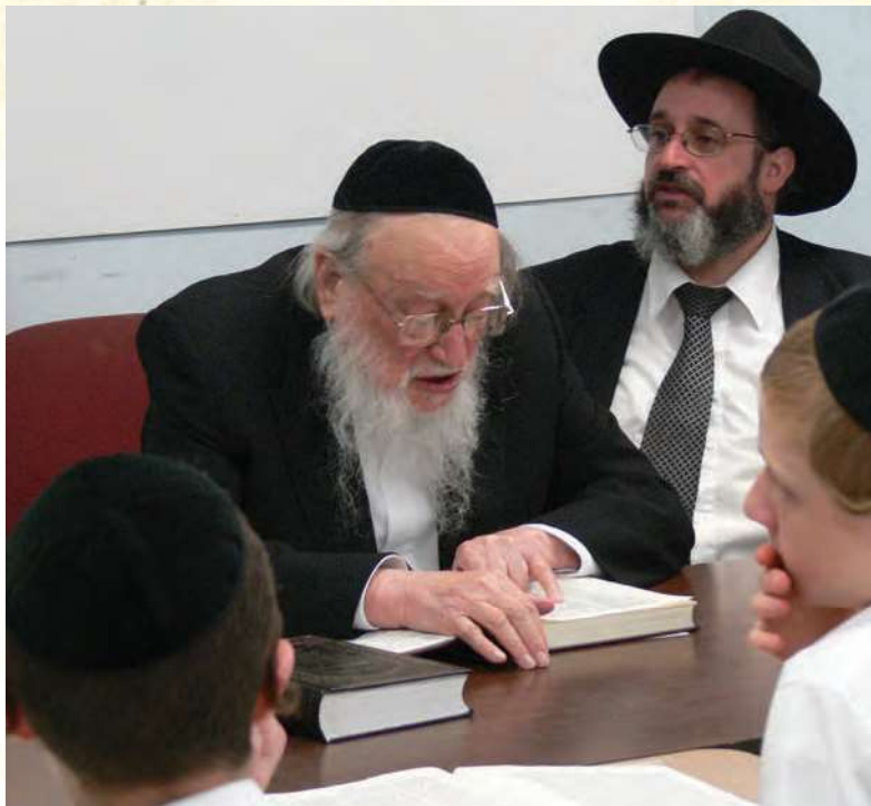
Farthering bachurim in Kaminetz Yeshiva, Lakewood