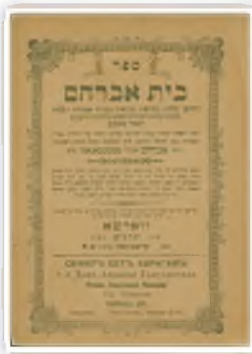
צילום מהעותק הראשון של הספר 'בית אברהם'

ואהל ציונו, אך דלת האוהל לא נפתחה, כל פעולותיו לפתוח את הדלת לא הועילו. נרעד רץ השמש לרב העיר כשהוא חושש שמא יד נכרים בדבר. בגלל קוצר הזמן, דחה הרב למוצאי שבת. מיד בצאת השבת נחפז הרב והלך עמו אל האוהל והנה הדלת נפתחת ללא כל קושי. באיזה שעה ניסית לפתוח את הדלת - שאל הרב. בערבו של יום - השיב השמש. נזכר הרב, בתקנת רבינו, שלפיה כבר היה זמן קבלת שבת באותו זמן, ולכן לא נפתחה הדלת. ואף שברחבי העיר בוטלה התקנה לאחר מלחמת העולם הראשונה, על מקום מנוחתו לא הניח הרב מטשכנוב בעצמו לבטלה. בשמעו עובדא מופלאה זו הפטיר מון שליט"א: "זה מעשה נפלא שצריך להדפיסו".