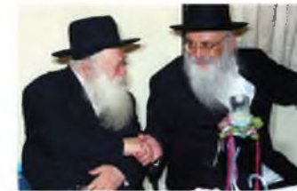
רַבֵּינוּ (מִשְׁמַאֵל) עִם רַבֵּי חַיִּים גְּרִינְמָן

פְּעַם הַתְּבַטָּא רַבֵּי חַיִּים גְּרִינְמָן: רַבֵּי חַיִּים קְנִיבְסְקִי זָכָה בְּאוֹפֵן מִיּוֹחַד שֶׁכֵּל נִכְדָּיו יִנְשְׂאוּ בְּגִיל צַעִיר, וְלֹא יִהְיוּ מַעֻכְבֵּי זִיווּג, וְהַסִּיבָה הִיא - מִדָּה כְּנֶגֶד מִדָּה, הוּא מִסֵּר נִפְשׁוֹ כֹּל חַיּוֹ עַל גִּיל נִישׁוּאִין מוֹקְדָם, וְהִיָּה מִמְרִיץ אֶת יִלְדוֹ וְנִכְדָּיו לְהִנְשֵׂא צַעֲרִים, וְלֹא לְהַמְתִּין, (וְכֵן גַּם הִיָּה מוֹדָה לְהַמְתִּין בֵּית יִשְׂרָאֵל שֶׁצָּבָא עַל פֶּתַח, וְלִמְרוֹת שְׁבַעֲלוֹם הִישִׁיבָתָה מִקּוֹבֵל לֹא לְהִישָׂא בְּגִיל צַעִיר כֹּל כֵּן), לָכֵן זָכָה שֶׁנִּכְדָּיו אֵינִם מַעֻכְבֵּי שִׁדּוּךְ;