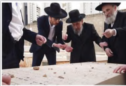
רבינו ביום הארציט השנה ה' טבת תשפ"ה בציון אביו זצוק"ל